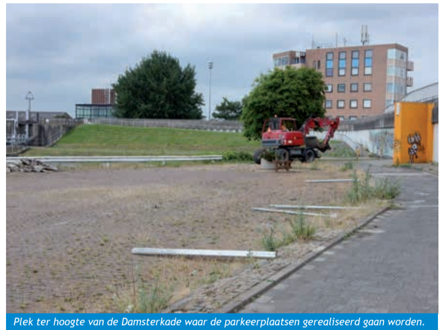
Plek ter hoogte van de Damsterkade waar de parkeerplaatsen gerealiseerd gaan worden.

In april is besloten aanvullende parkeermaatregelen te treffen in verband met de verwachte toename van verkeer door de komst van het Gezondheidsplein Molenberg aan Plein Molenberg in Delfzijl. Eén van deze maatregelen is het realiseren van dertig parkeerplaatsen ter hoogte van de Damsterkade. De waterpoort ter hoogte van de Kerkstraat in Delfzijl wordt toegankelijk gemaakt voor auto verkeer (met hoogte beperking), zodat men de parkeerplaatsen bij de Damsterkade vanaf de Oude Schans kan bereiken. Ook is in de Kerkstraat het rijden in twee richtingen straks weer mogelijk. Tot slot komen er op zowel Plein Molenberg als het Commandementsplein meer blauwe zone parkeerplaatsen.