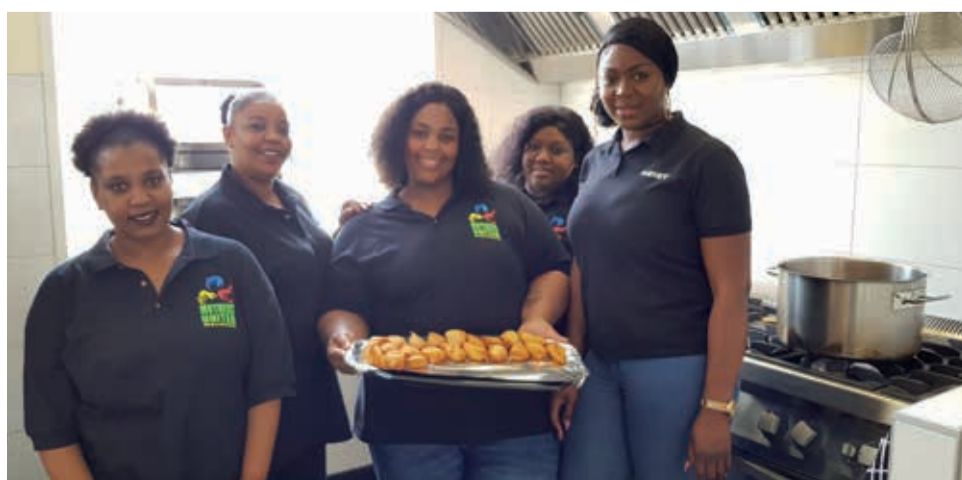
De opening van Mothers United.