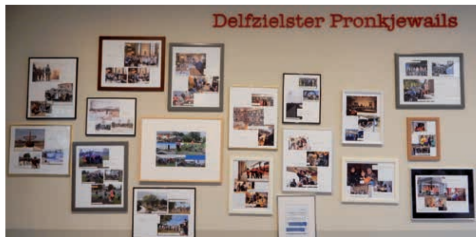
Delfzielster Pronkjewails in de hal van het gemeentehuis in Delfzijl.

Op vrijdagmiddag 23 november 2018 om 16.00 uur vindt er in het gemeentehuis een feestelijke bijeenkomst plaats waarbij de geselecteerde initiatiefnemers in het zonnetje worden gezet.